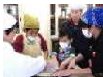
▲ 「しっかりこねるよ。」