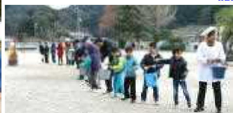
▲ 地域の皆様と防災教室 バケツリレーで消火訓練