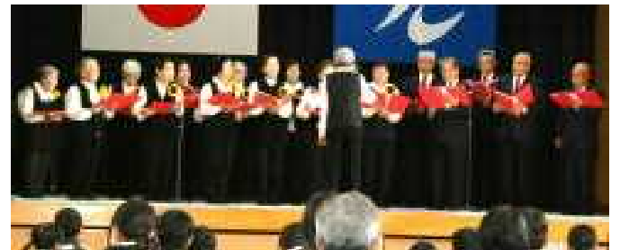
▲すてきな歌声を聴かせてくださった石城うたの会の皆様

「できるよになつたこと」や「紙しばい」の時、大きな声でゆっくり話すことができました。 「ニヤティティソーラン」は、いつものようにおどっているとき、楽しくなり、自ぜんと笑顔になっていました。はげしくおどることをくふうしました。 楽しく発表ができました。 三年生