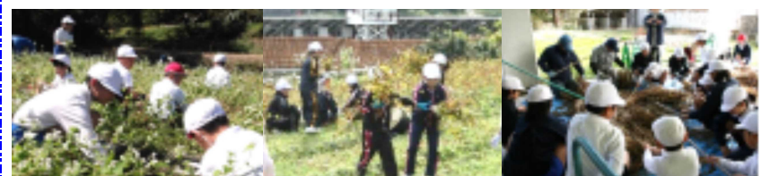
▲ 草取り→鎌を使って刈り取り→脱穀

9月初旬の種まき、畑の草取り、11月のそばかり、そばの実の脱穀、そして、そば打ち体験教室と、地域の皆様のお力により、子どもたちは貴重な体験ができました。ふるさと塩田を実感する機会になりました。ありがとうございました。