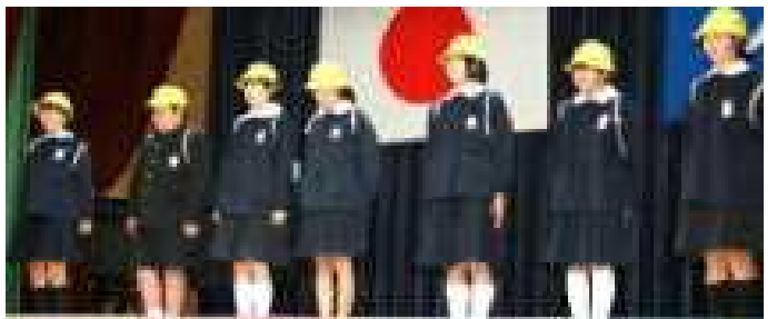
▲思い出の修学旅行を劇にして熱演した6年生

「しよう来のゆめ」や「紙しばい」では、間をとって、大きな声で「はっきり」「ゆっくり」を意識してがんばりました。「ニヤティティソーラン」は、大きく動作をするようにしました。 これまでより、大きな声で発表できたし、自分で立てた目標がたっせいでできたのでよかったと思います。 四年生