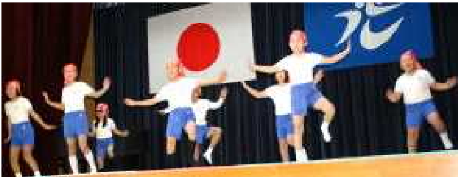
▲表現「ニヤティティソーラン」を軽快に踊った3・4年生

きんちようしたまま、はじめのことばを言いました。きんちようしていただき、大きい声を出せるかとてもしんぱいでした。けれど、大きい声が出せたのでうれしかったです。家に帰って、お父さんやお母さんに、「学しゅうはっぴよう会、上手だった。」と、聞いたらし、声もよく出てたよ。」と、ほめてくれたのでとてもうれしかったです。 二年生