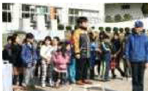
▲ 元気いっぱい今年の抱負を発表