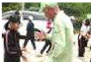
[山頂では、大和更生保護女性会、大和青少年アドバイザーの皆さんとゲーム]