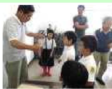
ブンブンごま「すごい！どうしたら上手く回せるのかな？」