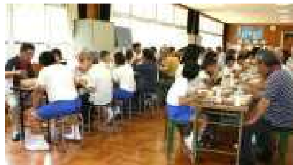
▲たくさんのお話をしながらの給食

わたしは、クラブかつどうが大 きです。ちいきの方に教えてもら て、バトルまでできるようになり ました。 でも、友だちのサーブがとれな ったり、うちかえしても入らな たりするので、もっともつとれ ゆうしたいです。上級生になっ たら、ちいきの方と同じくらい なりたいです。そのため、今、 がんばります。 三年生