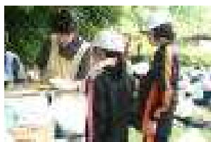
[昼食は、更生保護女性会の方の手作りバーをいただく]