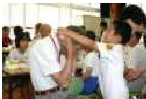
▲1・2年生が、感謝のメダルプレゼント

日頃からお世話になっている見守り隊と塩田老人クラブ卓球同好会の方々をお招きし、一緒に給食をいただきました。