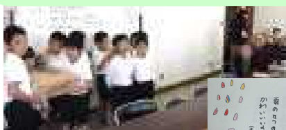
手作りカレンダーをプレゼント

1・2年生が塩田公民館の生き生きサロンに参加。手作りカレンダーを差し上げた後、遊ばせていただきました。