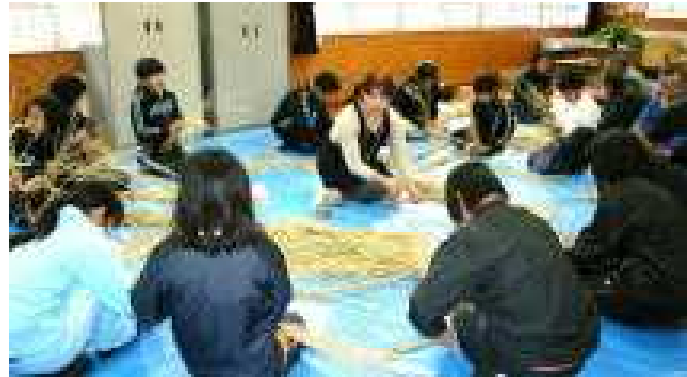
▲ 6年生が、地域の方に打ち方を教わって飾り用のわらを準備しました。

しめなわの作り方を教えて くださって、ありがとうございます。 今年、五回目になりました。 た。手の感かくを覚えていた ので、比較的早くできて、し めなわが二つできました。し かし、ゆずり葉やこんぶ、う らじろなどは、つけ方を覚え ていなかったもので、教えても らいました。 来年は、最後のしめなわ作 りなので、三つ作れるように したいです。来年も、よろし くお願いします。 五年生