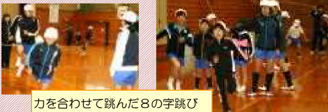
力を合わせて跳んだ8の字跳び

子どもたちは、自分のめあてをもっていろいろな跳び方に挑戦しました。前半は個人で、持久跳び、かけ足跳び、ステップ跳び、チャレンジ跳びに、後半は、なかよし班で長縄で8の字跳びに挑みました。