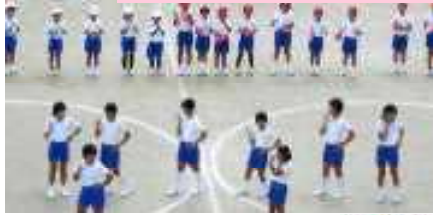
運動会が盛り上がるように、6年生がリードしたダンス！