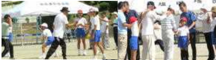
地域の方々との思い出がいっぱいできた、石城山じゃんけん・じゃんけん列車