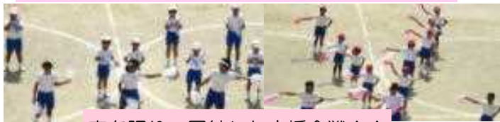
声を限り、団結した応援合戦！！