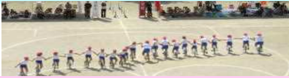
力を合わせた一輪車、大車輪が見事に完成！！

たくさんのご声援、準備や競技への参加、最後の片付けまで、本当にありがとうございました。