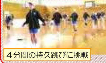
4分間の持久跳びに挑戦