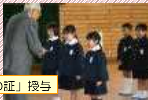
新3年生に「ジュニア福祉員の証」授与

新3年生にジュニア福祉委員の委嘱が行われました。地域の皆様にもご協力いただいて集めた、プルタブやペットボトルのキャップを大和地区社会福祉協議会に寄贈しました。子どもたちは、これからも、地域に思いやりの輪を広げていく決意をいたしました。