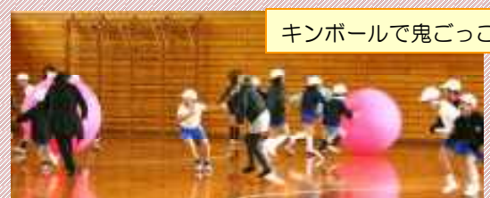
キンボールで鬼ごっこ