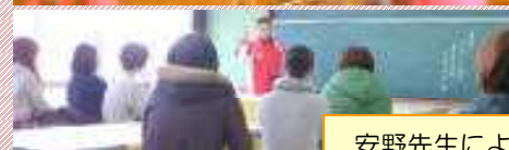
安野先生による講話