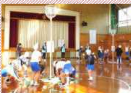
グループ対抗で行ったアジャタ