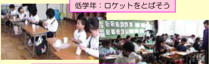
低学年：ロケットをとばそう

学級ごとに、交流会も行いました。子どもたちはすぐにうち解け、楽しい思い出を作ることができました。