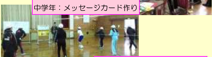
中学年：メッセージカード作り